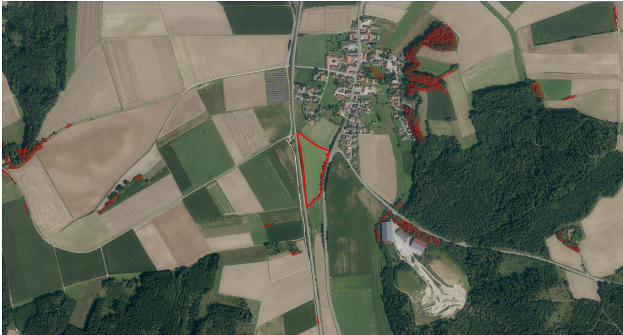
Abbildung 1 : Auszug aus Biotopkartierung

Im Planungsgebiet finden sich keine Flächen nach ABSP oder Biotopkartierung. Die nächsten Biotope befinden sich erst wieder in einem Abstand von mehr als 150 m.